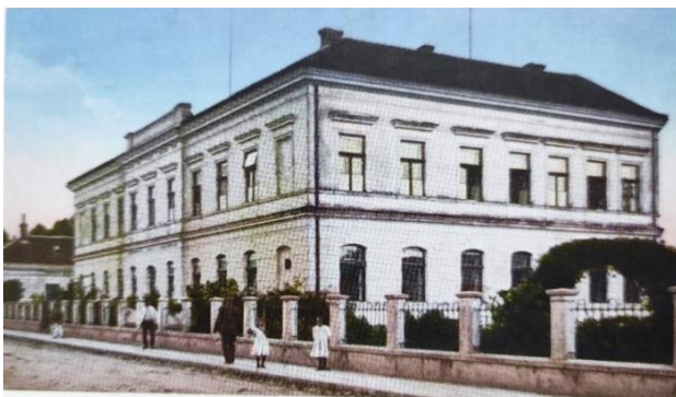
Зграда Трговачке школе у Брчком, 1903. године

Брчко има веома дугу традицију трговачког и економског образовања. У јесен, 1883. године, у Брчком је основана Трговачка школа, прва школа те врсте у Босни и Херцеговини. Први смјештај новоосноване школе био је у старој згради општине, а 1884. године Црквена општина Српске православне цркве дарује земљиште за зграду трговачке школе која је завршена 1885. године. Школа је имала четири разреда и 35 генерација од школске 1883/84. до 1918/19. године.