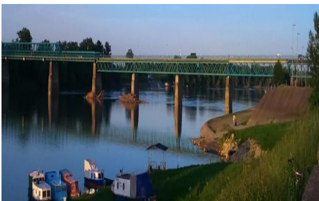
Мост на Сави, Брчко – Гуња (Р. Хрватска)

Брчко дистрикт Босне и Херцеговине, одлуком Међународног трибунала, успостављен је 8. марта 2000. године и по свом Статуу је јединствена административна јединица локалне самоуправе под суверенитетом Босне и Херцеговине. Има властиту администрацију, полицију и правосуђе.