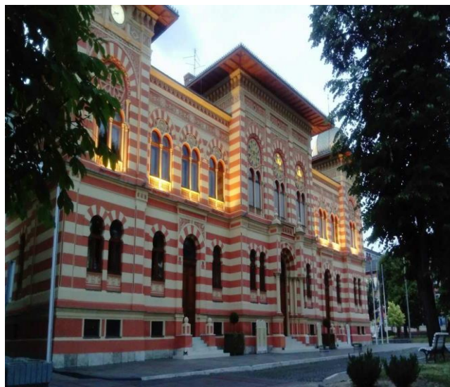
Градска вијећница – Влада Брчко дистрикта БиХ

Према неким изворима Брчко се спомиње и око 1620. године у опису Босанског пашалука у саставу Тузланског кадилука и Зворничког санџака. Почетком осамнаестог вијека Брчко долази под власт Аустрије од Пожаревачког до Београдског мира (1718-1739) када се успоставља граница на ријеци Сави између Османског царства и Аустрије. Средином XIX вијека Брчко с околином постаје котар на површини од 920 квадратних километара који је у свом саставу имао 90 села. Септембра 1869. године у Брчком је уведен телеграф, град је био повезан модерним путем са главним центром Сарајевом, а 1870. године Брчко добија пошту.