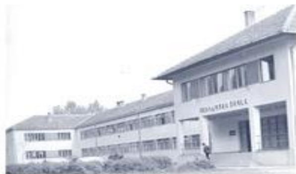
Зграда Економске школе из 1961. године

На четрдесетогодишњој традицији постојања Трговачке школе, коју је завршило преко 600 полазника, у Брчком је, 1923. године, основана Трговачка академија. Међутим, почетком школске 1930/31. године Трговачка академија је из Брчког пресељена у Бањалуку. Од оснивања, па до пресељења у Бањалуку, Трговачку академију у Брчком завршила су 232 полазника.