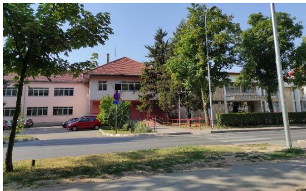
Економска школа и Економски факултет, 2021.

Школа се налази у Студентској улици бр. 9, у објекту који заузима 2.200 m 2 .