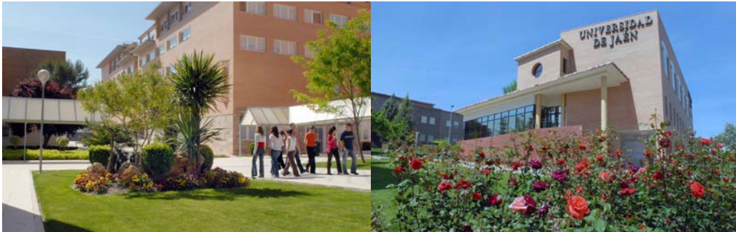
Kampus univerziteta u Jaenu

Prema mojim saznanjima na Univerzitetu se u ovom trenutku nalazi preko 1000 studenata iz cijelog svijeta kako u okviru Erasmus + programa, tako i u okviru drugih programa razmjene. Univerzitet u Jaenu je relativno mlad Univerzitet koji je osnovan 1993. godine. Nastava se odvija u kampusu Univerziteta gdje se nalaze mnogobrojni fakulteti.