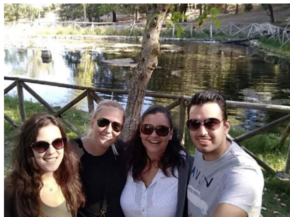
Izlet sa studentima iz Grčke

Mene posebno raduje mogućnost učenja španskog jezika i unapređenja znanja engleskog jezika, kroz praćenje nastave i komunikaciju sa studentima iz cijelog svijeta.